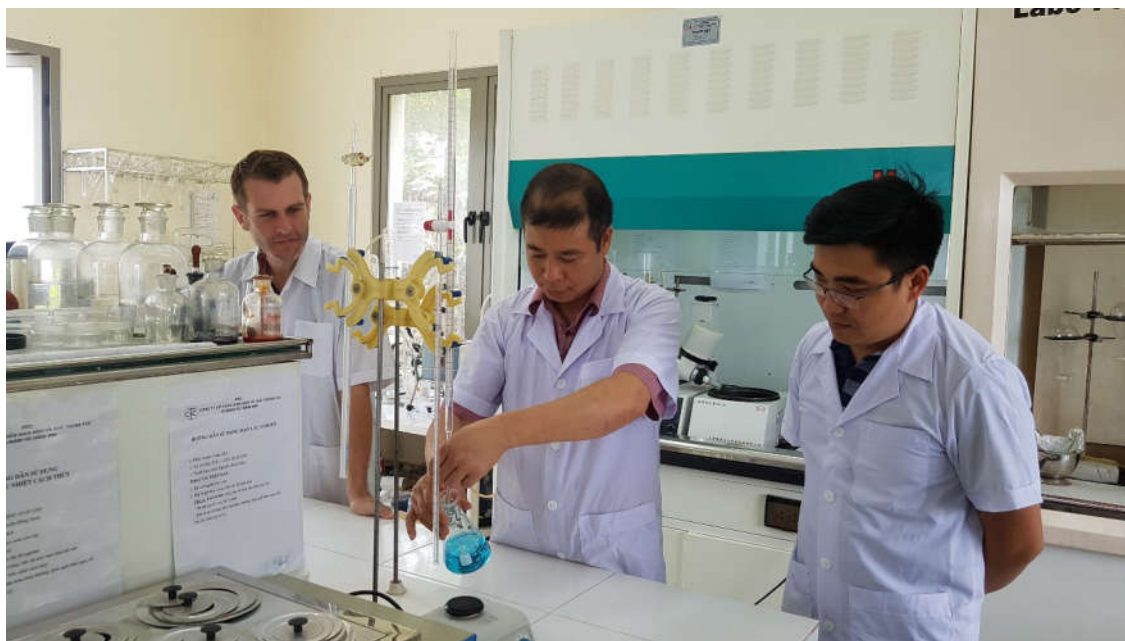
Phân tích xác định Formaldehyt và các amin thơm