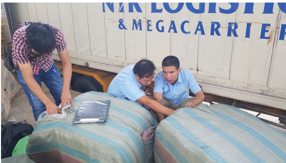
Kiểm tra/lấy mẫu sản phẩm dệt may