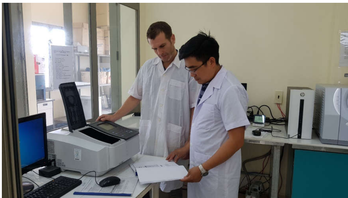
Máy quang phổ UV-1800