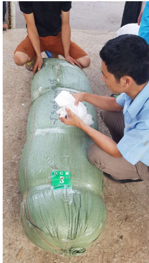
Kiểm tra/lấy mẫu sản phẩm dệt may