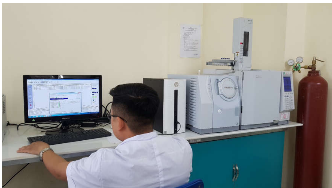
Hệ thống sắc ký khí, khối phổ GC/MS QP2010 Ultra